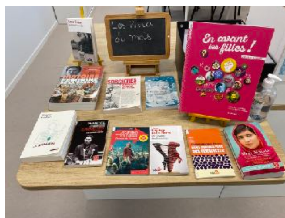
Des expositions et ouvrages mis en avant tout au long de l'année

Horaires d'ouverture affichées sur la porte d'entrée