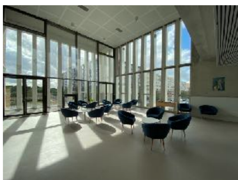
Un Espace de Lecture dans un cadre lumineux