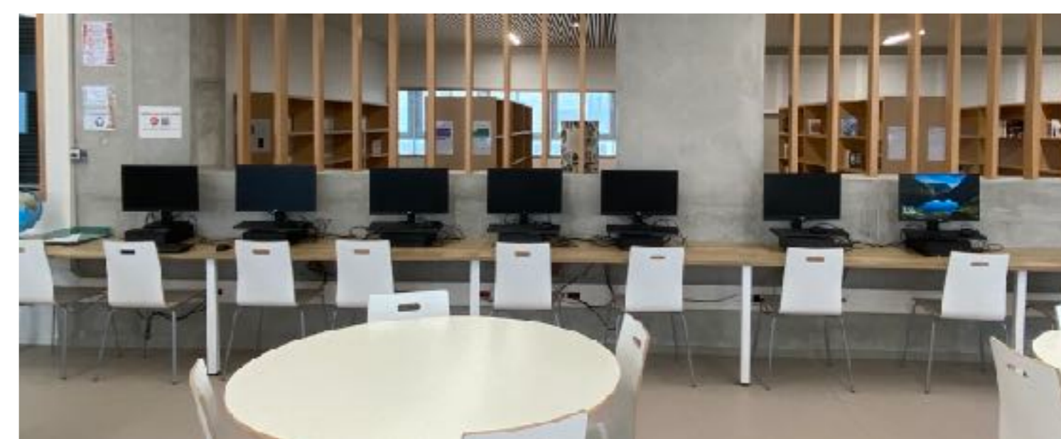
Un Espace de Recherches, avec 18 postes informatiques et de nombreux documentaires + 1 Salle multimédia, pour un accueil pédagogique