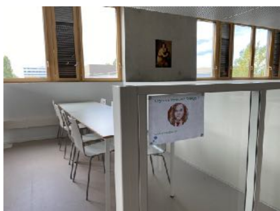
Un Espace de Travail, avec cinq loges disponibles