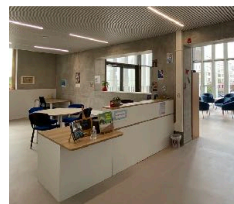
La possibilité d'emprunter livres et revues, 3 prêts simultanés pendant 3 semaines chacun