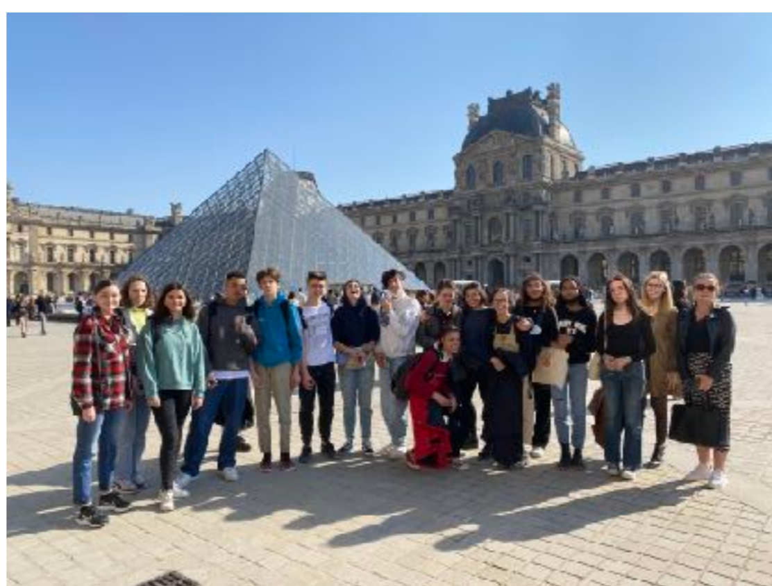
Sortie au Louvre, 23 mars 2022