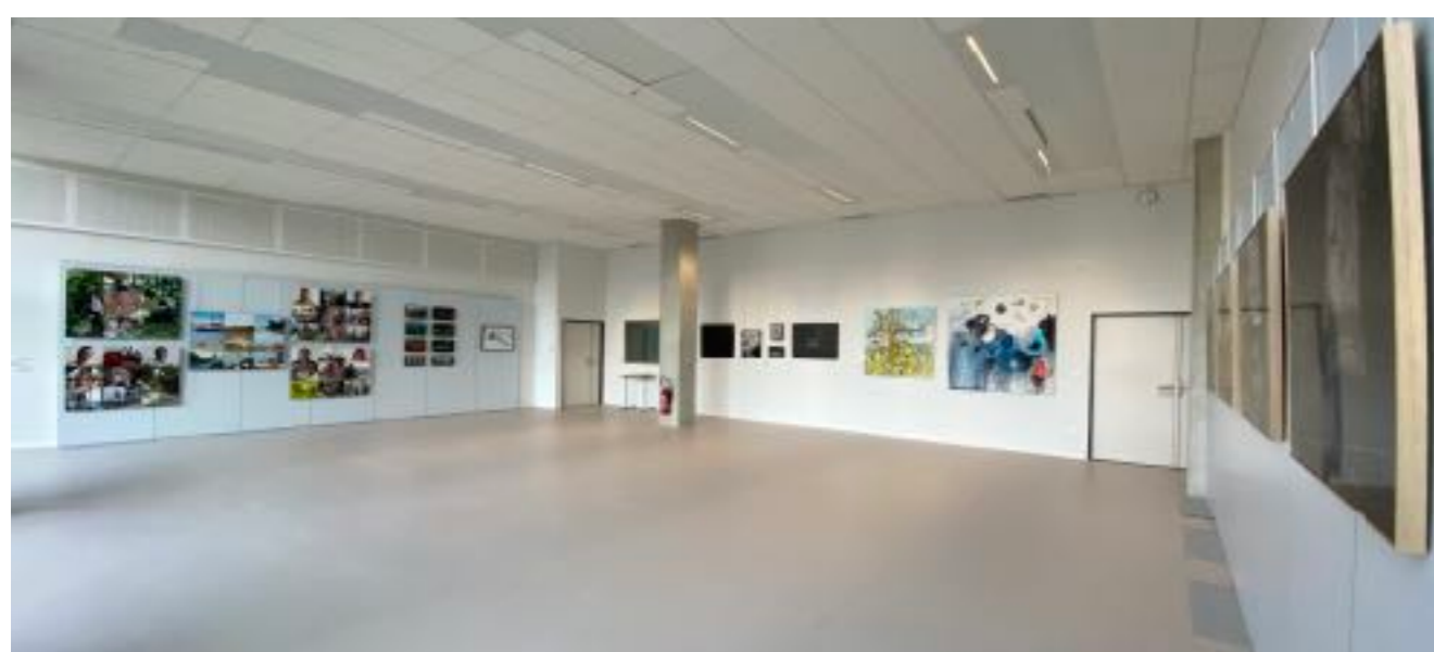
Exposition « Paysages », janvier / février 2022

Ainsi le lycée a accueilli en 2021-2022 deux événements majeurs : l'exposition itinérante Paysages et le Concert Ethno, mais également des interventions et colloques, par exemple autour du Land Art. Le projet « Aux Arts Lycéens » propose lui aux élèves volontaires d'aller découvrir des musées parisiens sur le temps périscolaire.