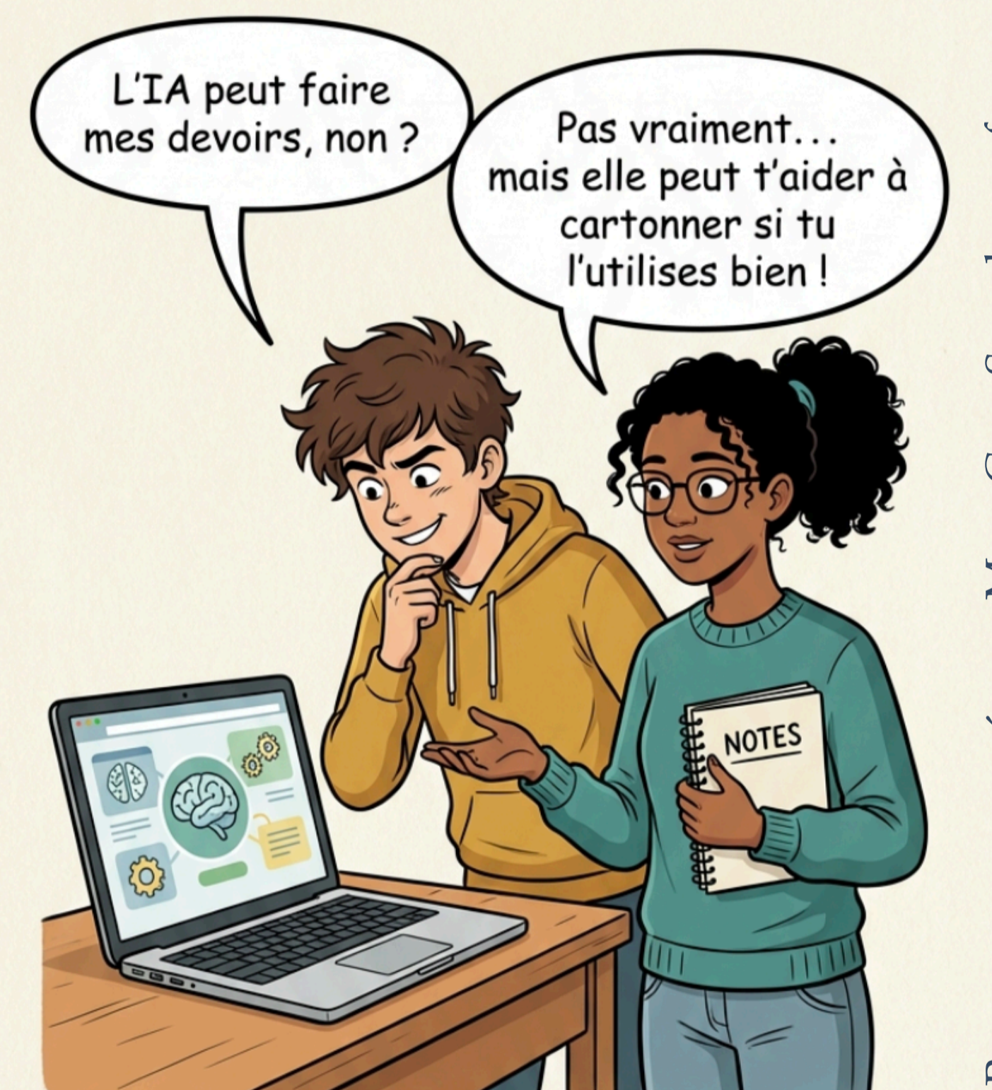
Ressource proposée par Mme Gras-Sayerle, professeure de N.S.I.